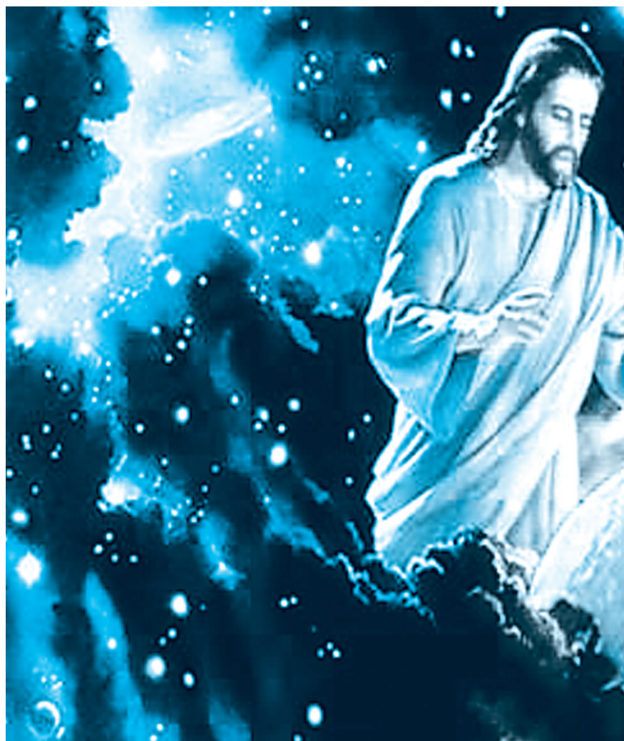
JESUS O CRISTO - GOVERNADOR ESPIRITUAL DO PLANETA